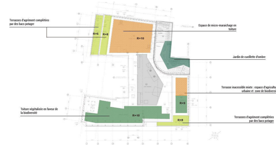
Plan des aménagements de végétalisation sur le bâtiment United

En parallèle nous avons pu travailler deux autres espaces pour du maraîchage. Nous avons décidé de mettre la production à disposition des usagers du site (herbes aromatiques et tisanes). Enfin les derniers espaces, beaucoup plus contraignants en termes de surfaces et de circulation des usagers ont été réfléchis et travaillés dans le sens de l'agrément des usagers. La gestion et l'entretien diffèrent grandement d'un espace à l'autre, il y a peu d'interventions sur les espaces dédiés à la biodiversité contrairement aux espaces de maraîchages et d'agréments.